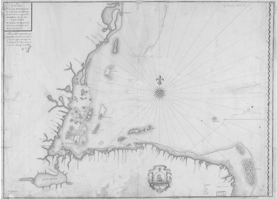
El Golfo de Honduras por Juan Linares (1756).