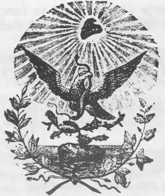
GOBIERNO del Estado de Michoacan.

XVII.- Pedirá aumento de sueldo para los funcionarios y empleados judiciales.