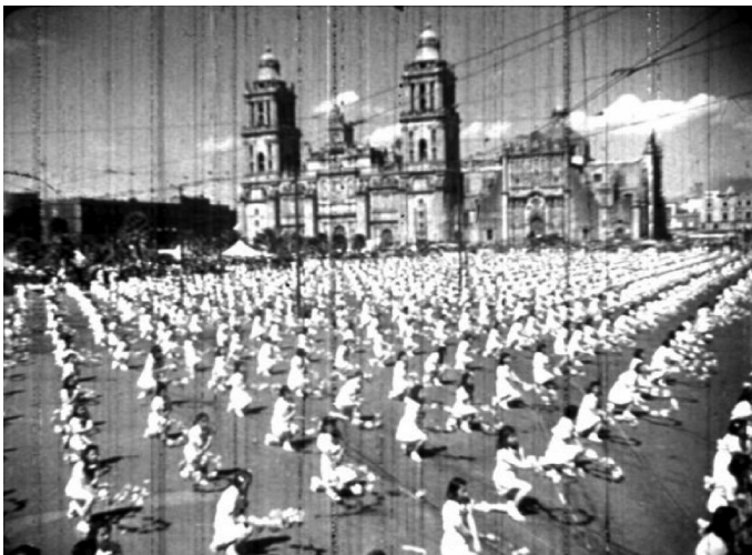
29 Aniversario de la Revolución Mexicana (DAPP, 1940).

La conquista de derechos sociales es representada continuamente en los documentales estudiados. Estos no retratan únicamente los espacios escolares, sino que sirven como un pretexto para extender la mirada hacia grupos históricamente olvidados por los gobiernos prerrevolucionarios. El caso de la población indígena, en esta búsqueda de justicia social, se encuentra representado desde distintas aproximaciones: condiciones de vivienda digna, higiene, acceso a la atención médica y aprendizaje técnico para mejorar sus sistemas de producción tradicionales.