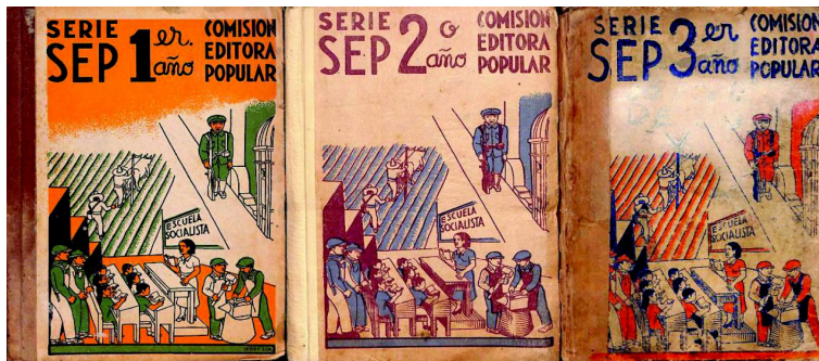
Portadas de los libros Escuela Socialista .

libros para la SEP), 18 llevan como portada el dibujo de un salón de clase: al frente, una maestra; detrás de ella, un pizarrón en el cual se puede leer “Escuela Socialista.” En el mismo dibujo se retrata a los obreros, los soldados y los campesinos. La serie se componía de seis tomos, cada uno correspondiente a un grado de primaria, y era identificado por el grado y un color distinto. Si tuviéramos que resumir la forma en que se socializó el proyecto educativo cardenista, esta portada sería un ejemplo exacto; por ello, explorar las distintas formas en que dicho mensaje se construía nos ayuda a comprender los motivos por los cuales, desde la perspectiva del gobierno, se consideraba que el cambio a este modelo era necesario.