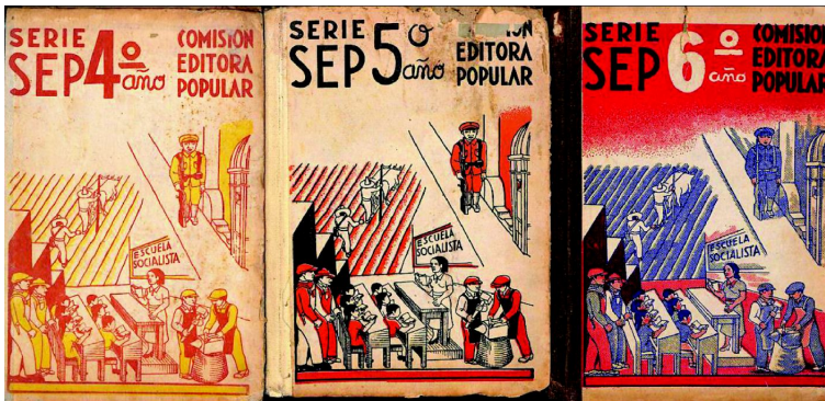
Portadas de los libros Escuela Socialista .

Otro aspecto relevante de los materiales revisados, es que el maestro aparece constantemente como el regulador y portador del conocimiento. Esto puede observarse tanto en los impresos como en las películas producidas por el DAPP.