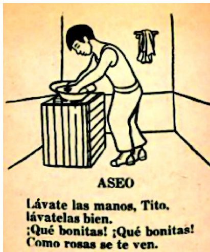
Serie SEP, Escuela Socialista 1 .

El texto fílmico contiene distintos niveles discursivos; como veremos a continuación, se recurre a narrativas múltiples, que se replica tanto en las películas como en los materiales impresos. Uno de los temas que vemos representados en los cuatro documentales es la necesidad de llevar una vida saludable, basada en la alimentación adecuada, el acceso a atención médica, la higiene y el deporte. Tanto en el documental Los niños españoles en México , como en El Centro de Educación Indígena se muestra la rutina matinal de los jóvenes: levantarse a las seis de la mañana, poner orden en sus espacios y tomar un baño, un baño que los hará más sanos, más fuertes y que los deja listos para su siguiente actividad. Ante la imagen de un niño español bajo la regadera, escuchamos la voz de Manuel Bernal exclamando: “¡Bravo, tú serás fuerte y ágil!”. En El Centro de Educación Indígena el discurso es más contundente; ante las espaldas desnudas de jóvenes indígenas que se bañan en lavaderos al aire libre, escuchamos al narrador decir: “Después de sudar un poco, impone el uso del jabón y del agua. ¿Cuántas promesas se advierten en las espaldas de estos adolescentes? Que no las usarán ya para llevar a cuestras pesados cargamentos”.