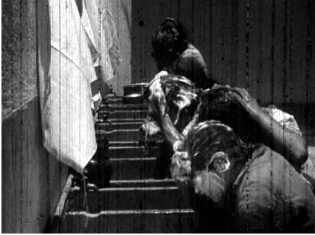
El Centro de Educación Indígena.

El discurso de esta escena está conformado a partir de la necesidad de observar una higiene correcta, pero va mucho más allá. El ejemplo de las jovencitas y los jóvenes lavándose sirve para denunciar el sometimiento y la falta de libertad de la población indígena, situación que, a partir de la Revolución, y a decir del Estado no tendría que continuar. Este tipo de juegos discursivos, como podemos ver, está presente en los cuatro documentales. De esta manera, los documentales funcionan como artefactos de carácter ideológico, propagandístico y educativo.